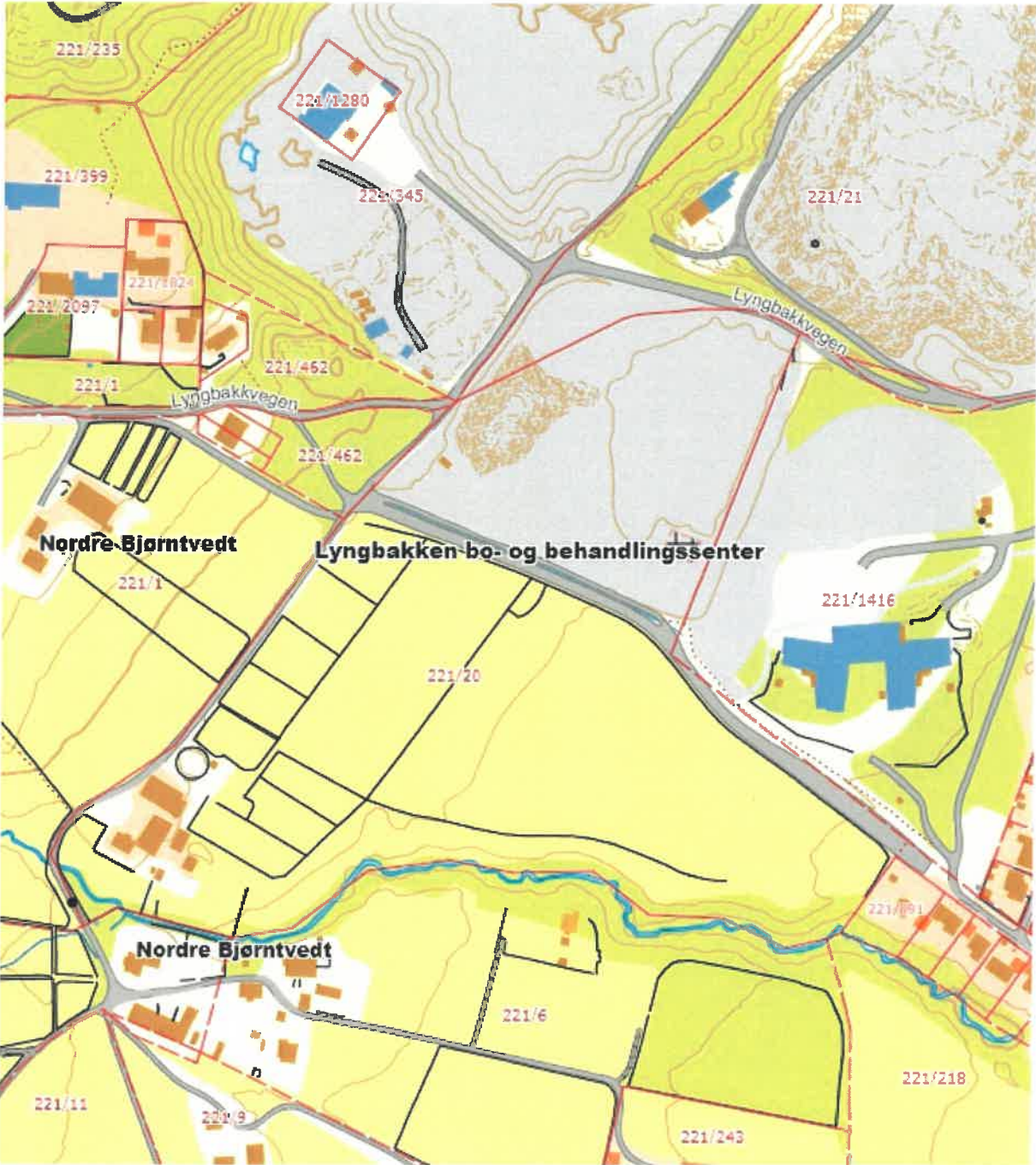
Vedlegg nr. 1. Oversiktskart over området. Målestokk 1:4000.