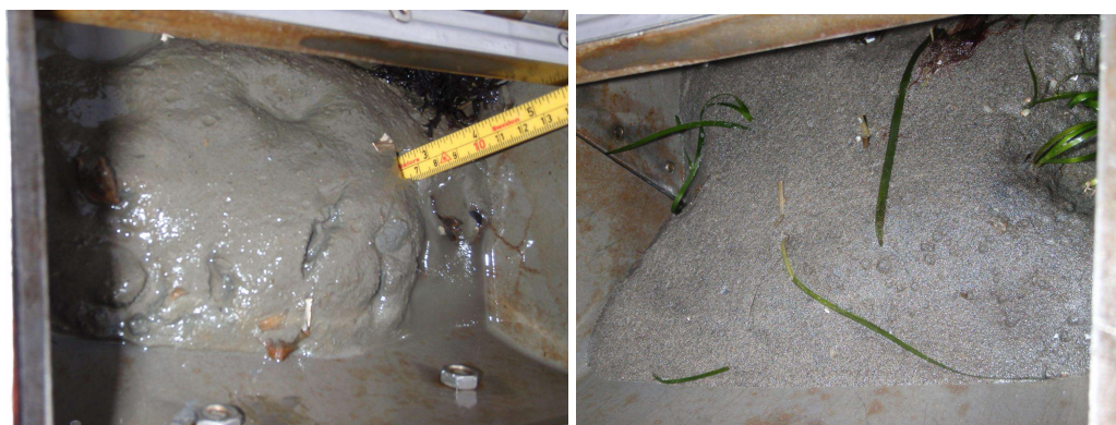
Figur 2: Sediment fra prøveområdet utenfor Holmestrand Fjordhotell avbildet i grabb etter drenering. Bildet til venstre viser en sedimentprøve fra prøvepunkt 3-2 som er typisk for stasjon 3. Bildet til høyre viser sedimentet fra prøvepunkt 4-1, som skilte seg mest fra øvrige prøvepunkt.

Observasjoner under prøvetaking viste at de øvre 0,5 cm av sedimentene primært besto av gråbrun, sandig leire og grå, fast leire under (Figur 2). Prøvene fra stasjon 4 skilte seg ut fra øvrige prøver med et tydelig høyere sandinnhold. Ved samtlige stasjoner ble det observert børstemarkrør, skjell / skjellfragmenter, sjøgress og noe annen bunnfauna. Ingen lukt, utover vanlig sjø, ble registrert.