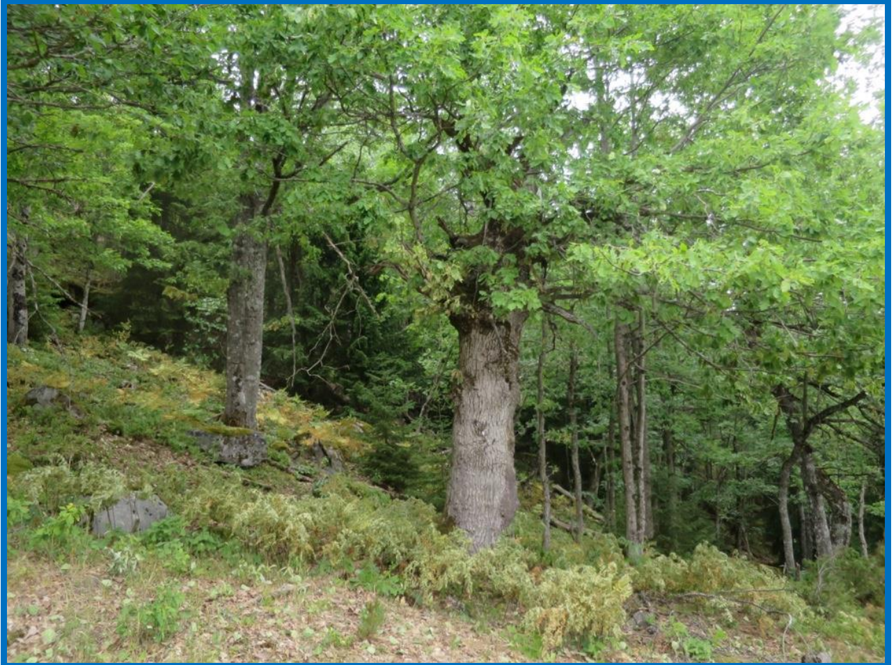
Gamle hule eiker i Østeråfjellet.