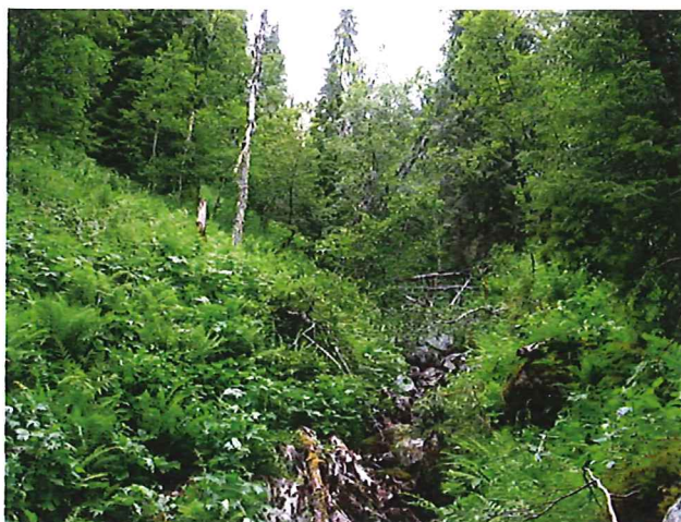
Frodig høgstaudeskog i Oppsaljuvet.