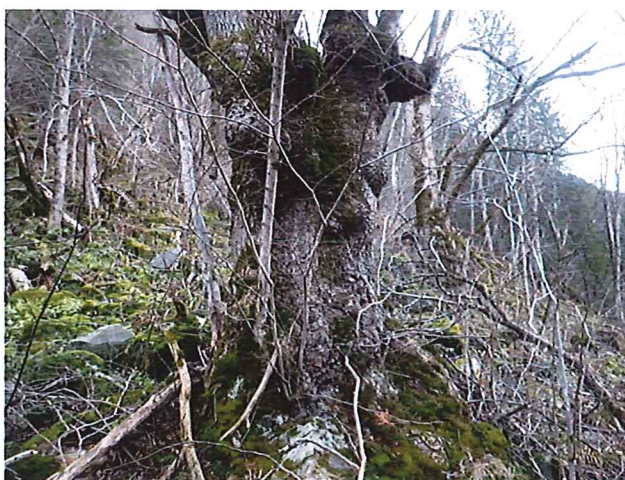
Grov, tidligere styvet alm i Rollagåsen.