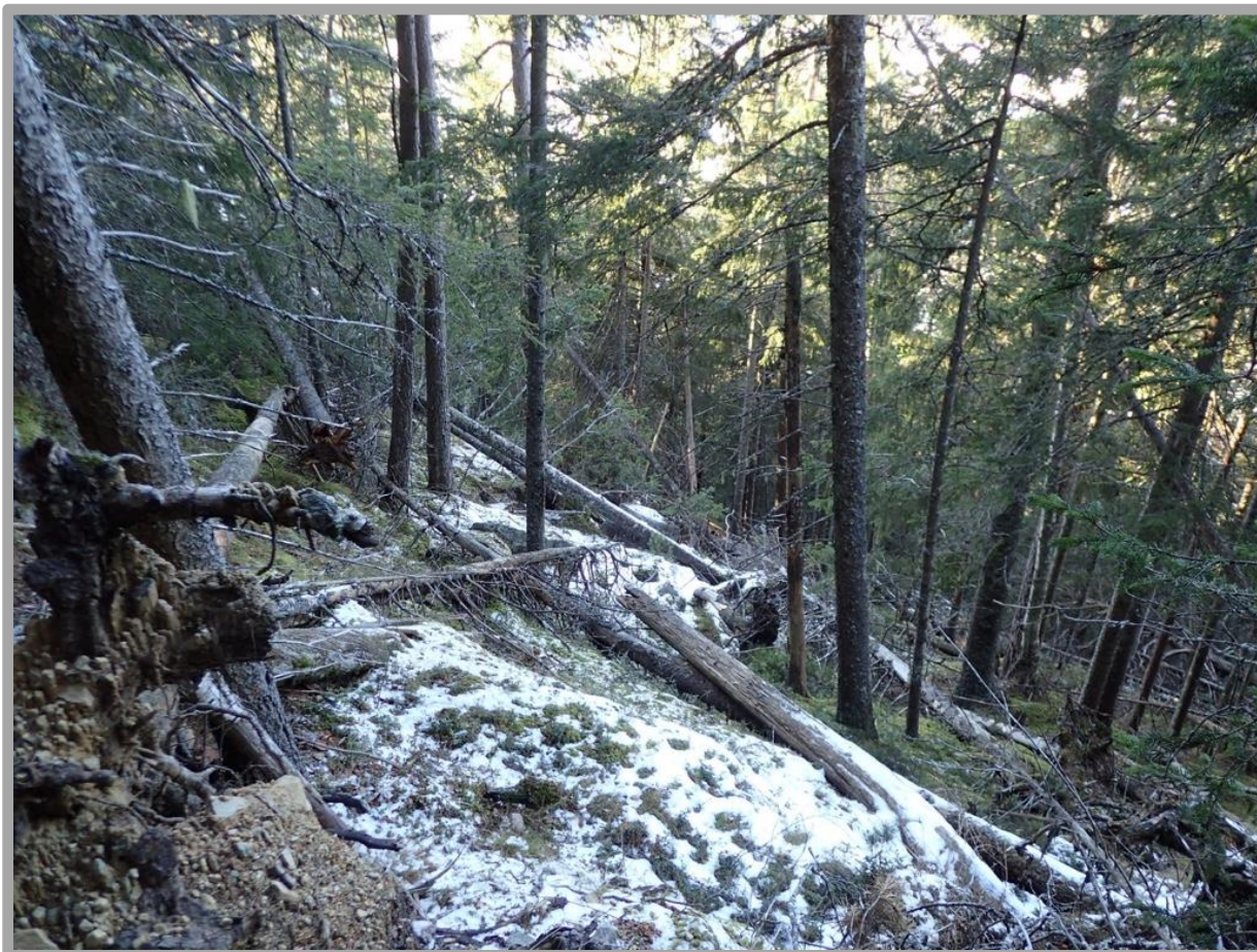
Rikelig med fersk død ved i liene.

(Arealet på eksisterende Midtstrondbekken naturreservat er 501 daa)