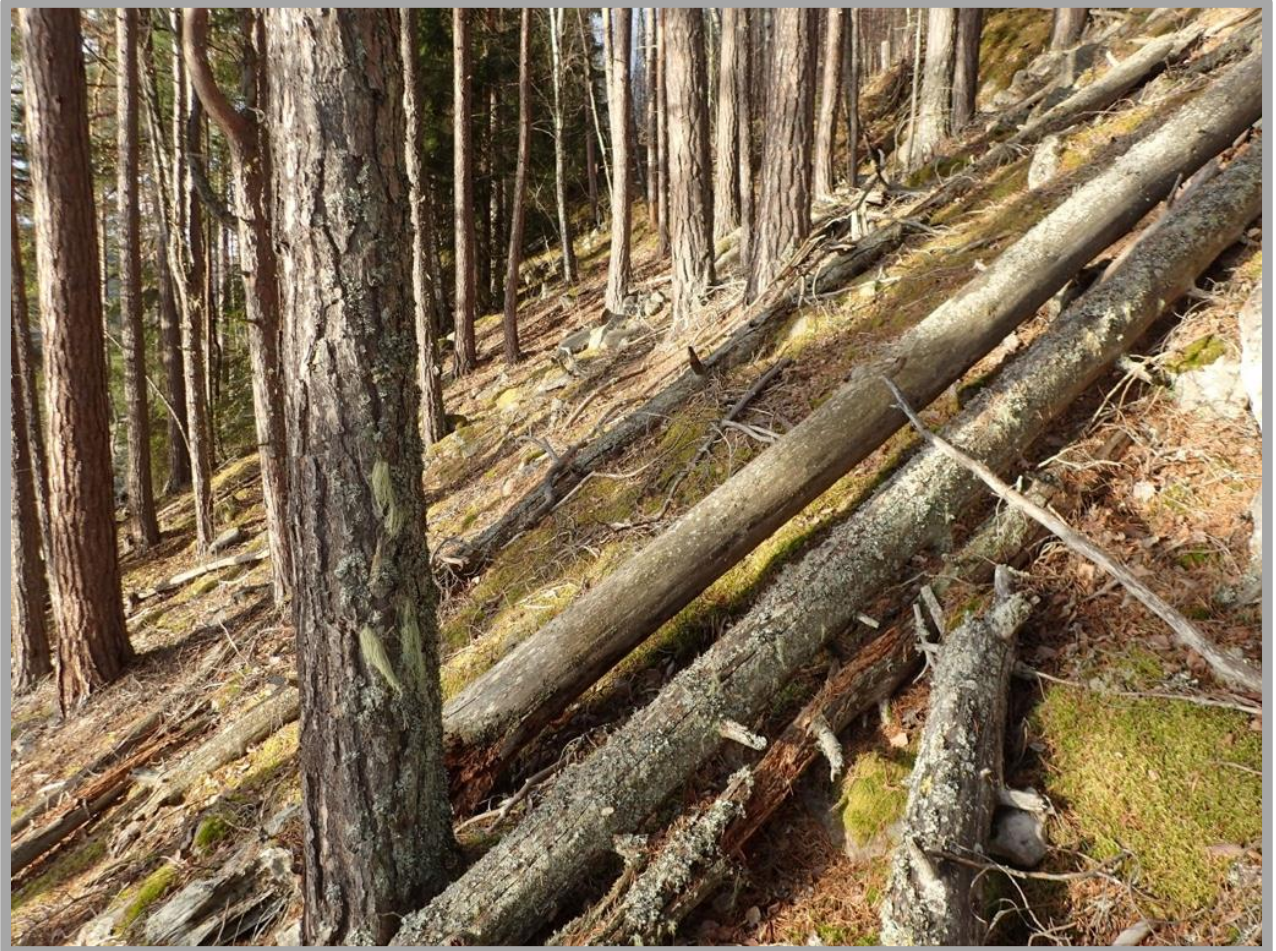
Sandfuruskog rik på død ved.

Utvidelse av Midtstrondbekken naturreservat, Tinn kommune