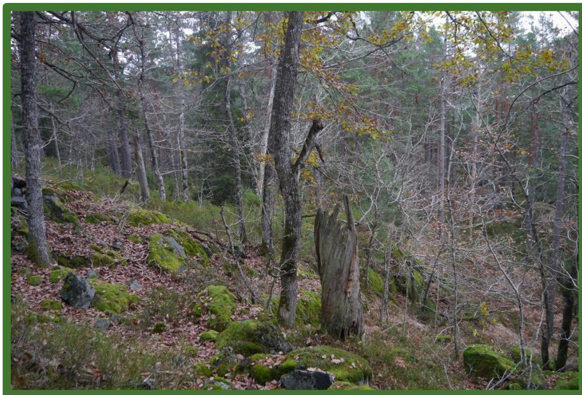
Høgstubbe av eik.