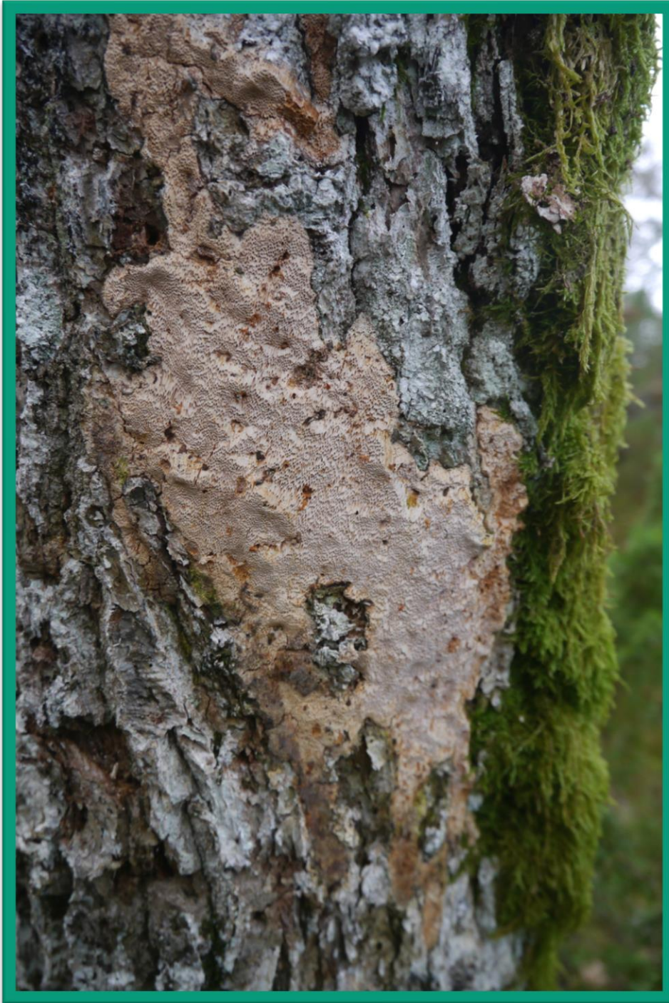
Eikegreinkjuka Pachykytospora tuberculosa.

Brynjulvsrud J. G. 2018. Naturverdier for lokalitet Korsvann, registrert i forbindelse med prosjekt Statskog2017. NaRIN faktaark. BioFokus