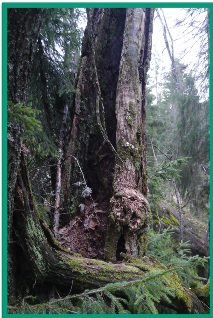
Hul eik innenfor verneforslaget.

Alternativ 2: Vern av Korsvann naturreservat