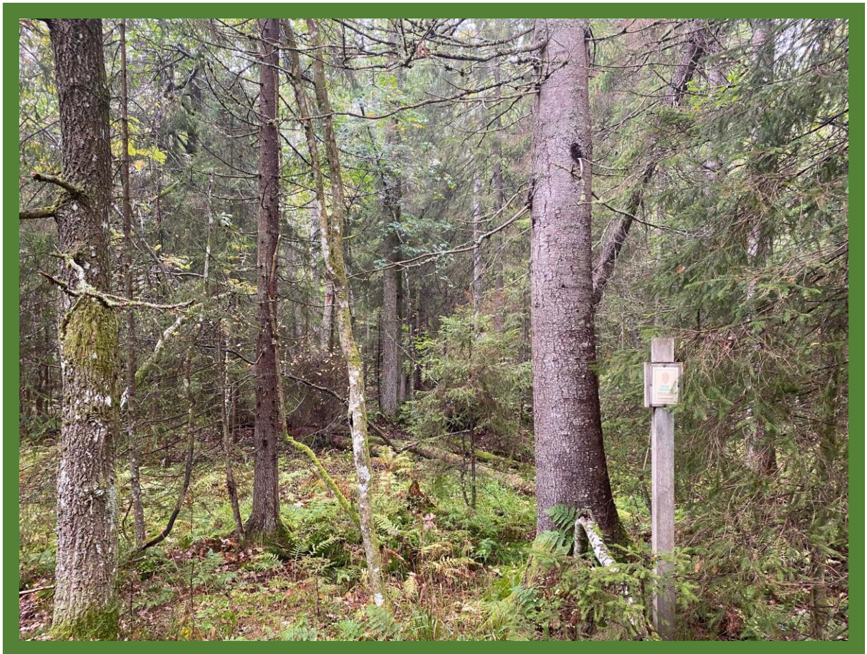
Sumpskog i eksisterende Korseikåsen naturreservat.