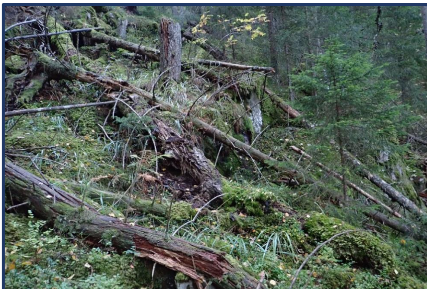
Parti rike på død ved i lokalitet Nestjønn.