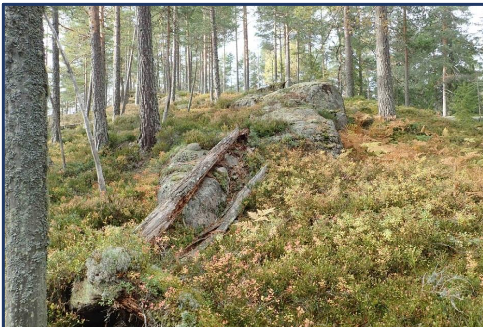
Fleiraldra furuskog nordvest for Bomhaug