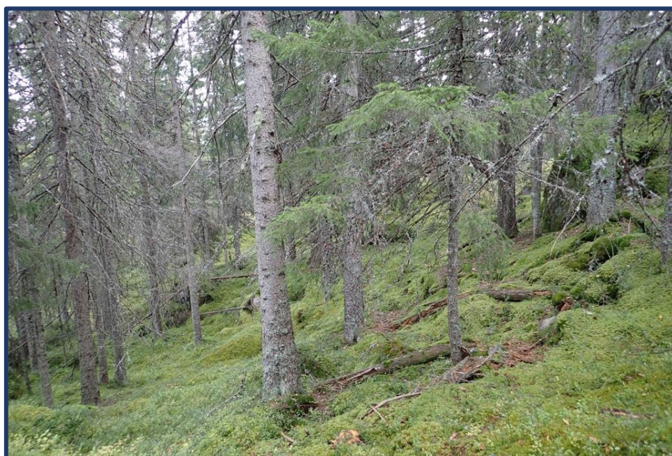
Gamal granskog i Nestjønnfjell Ø.

Etter høyringa vil Statsforvaltaren summere opp innkomne fråsegner, kommentere desse og utarbeide ei tilråding om vern til Miljødirektoratet. Miljødirektoratet vil etter dette lage innstilling til Klima- og miljødepartementet og vedtak om vern blir gjort ved kgl. res. av Kongen i statsråd.