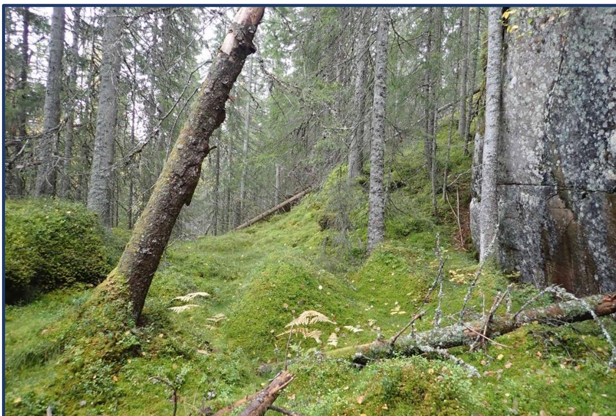
Gamal granskog i Skotmyrane Øst.

Statsforvaltaren i Vestfold og Telemark Januar 2022