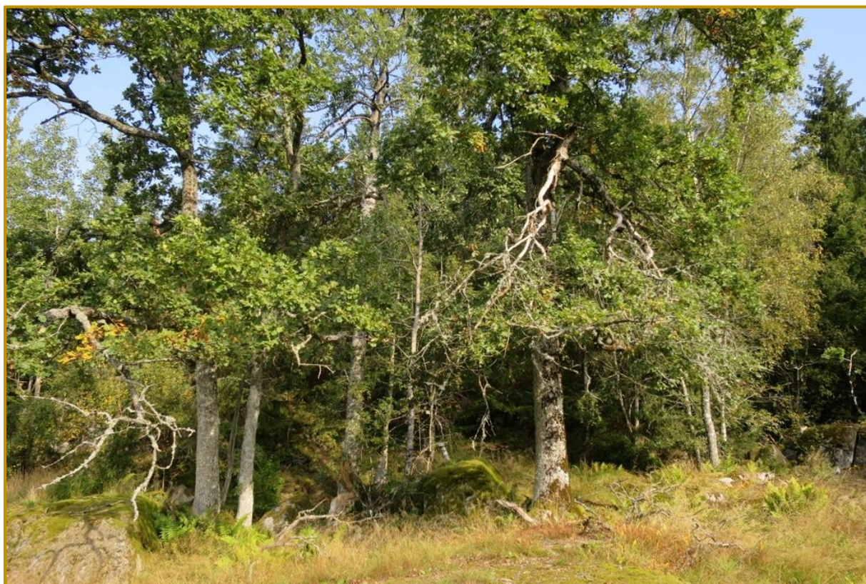
Rundt flere av toppunktene er skogen åpen med mye gressarter og gamle eiketrær.

Statsforvalteren i Vestfold og Telemark Oktober 2023