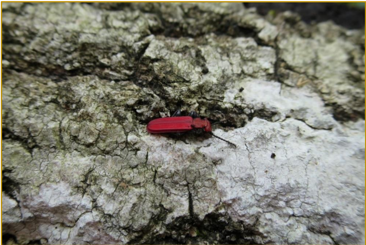
Sinoberbille ble påvist på svært mange lokaliteter innenfor området og har utvilsomt en god bestand innenfor verneforslaget.