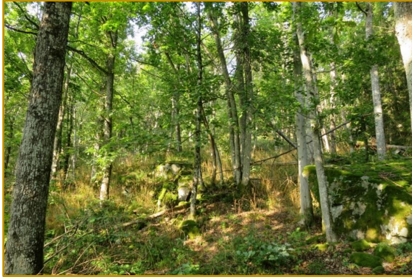
Rik blandingskog er vanlig i området, og stedvis er det klar dominans av eik, med blant annet innslag av en del osp.