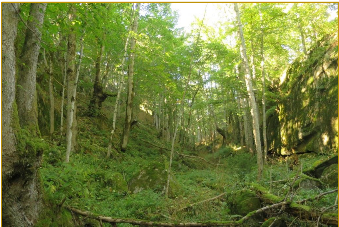
Et større skar med frodig og rik edelløvskog med innslag av noen grove, styvede almetrær, sørøst i området.