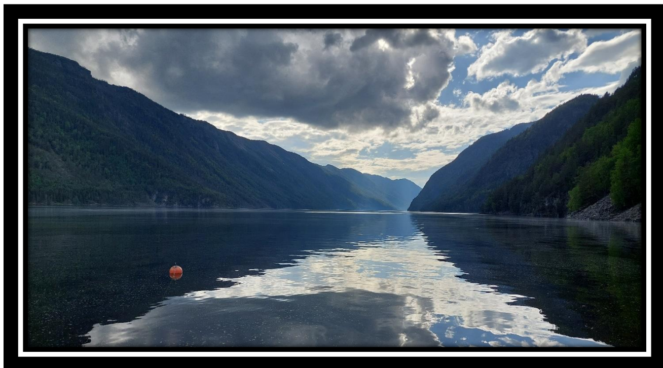
Utsikt over Bandak frå austenden ved Apalstod. Førreslege verneområde ligg på nordsida av Bandak.

Statsforvaltaren i Vestfold og Telemark Oktober 2024