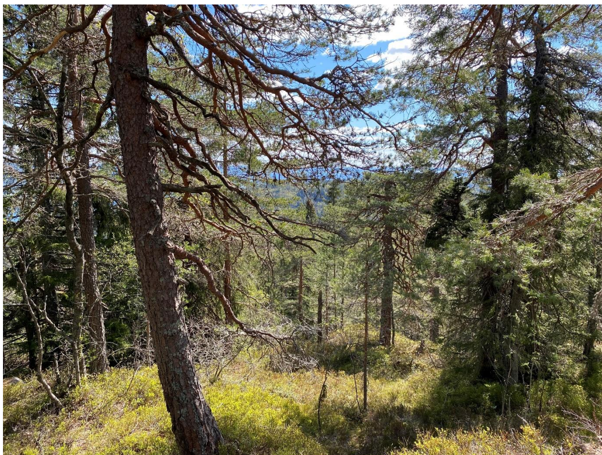
Gammel furuskog på toppen av Hvittingen