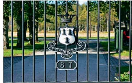
Med adgangskort kan man komme inn i parken. ▲

Landskapsvernområdet ble opprettet i 1980. Verneforskriften er senere endret i 2002 og 2004. Verneområdet er 1630 dekar stort.