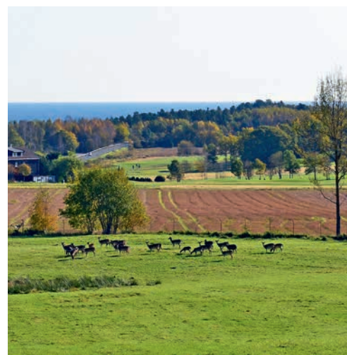
På 1920-tallet ble det satt ut dåhjort i parken. ▲

Adkomsten til verneområdet er gjennom hovedporten til Fritzøeparken. Besøkende må ha adgangskort. Det får man på hovedkontoret til Treschow-Fritzøe. Den indre parken, rundt Fritzøehus slott, er ikke tilgjengelig for allmennheten.