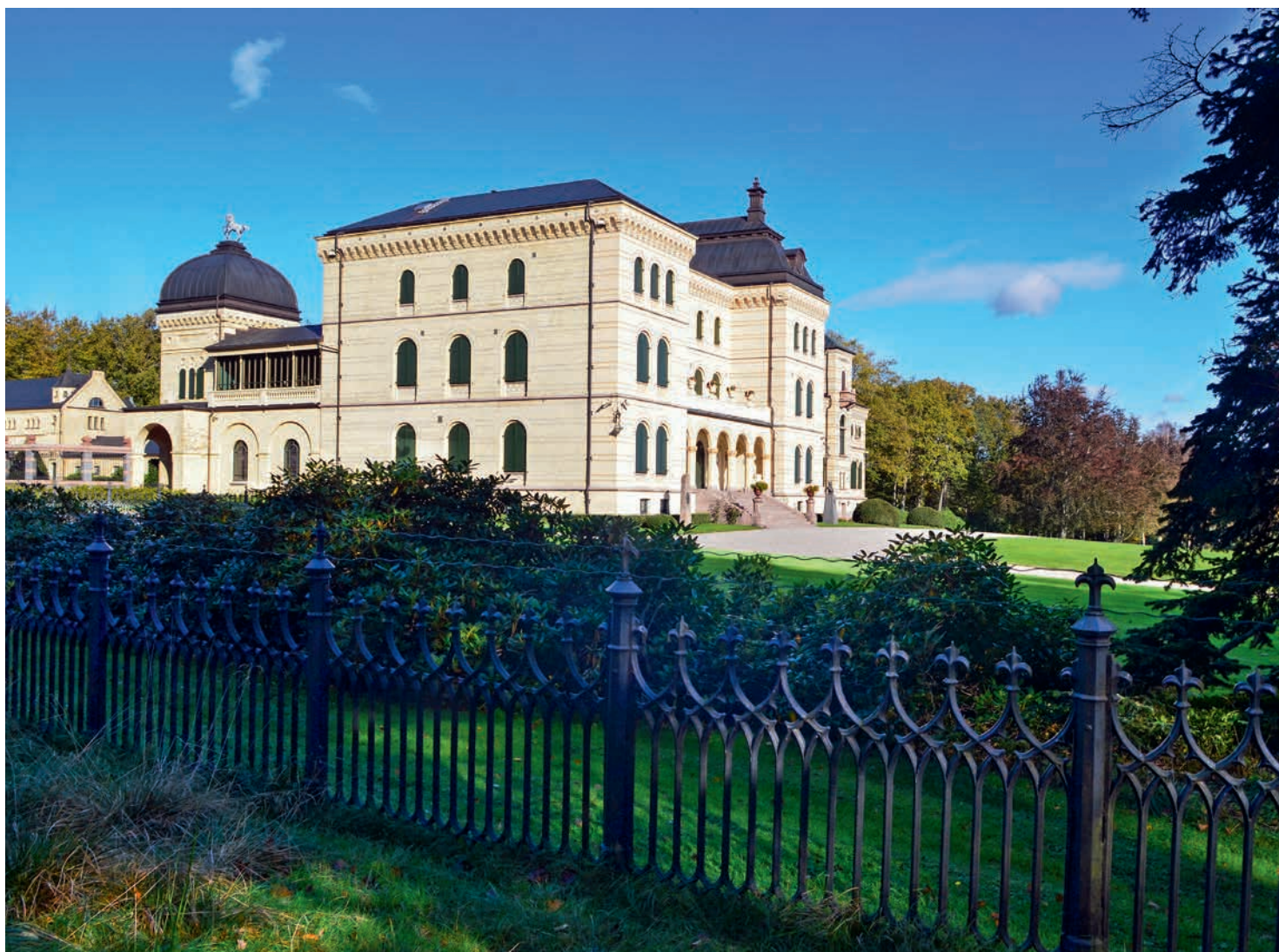
Fritzøehus slott ble oppført på 1860-tallet av Michael Treschow, og er inspirert av italiensk renessansestil. ▼