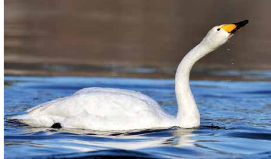
SANGSVANEN var et hovedmotiv for å verne området