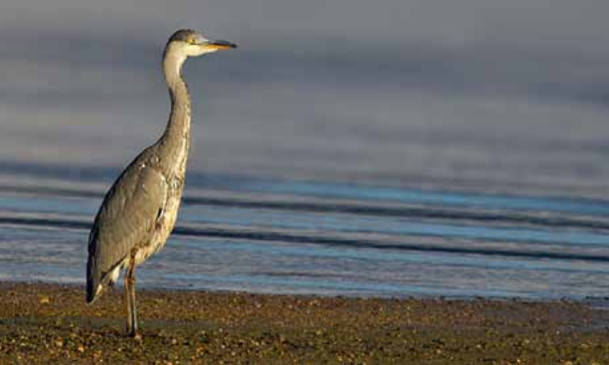
GRÅHEGRE, en årvåken fisker på grunna