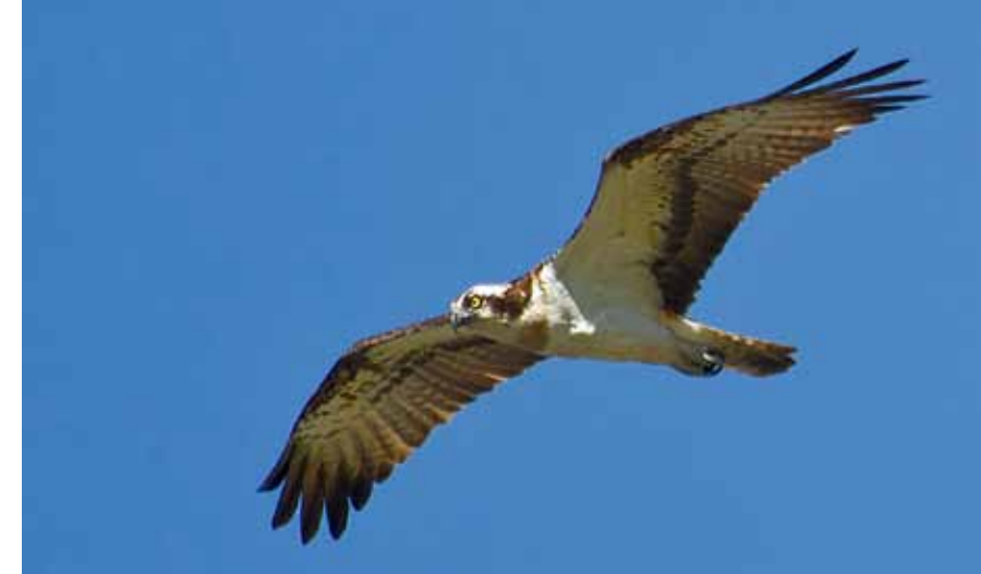
FISKEØRN flyr ofte på jakt over Grunnane