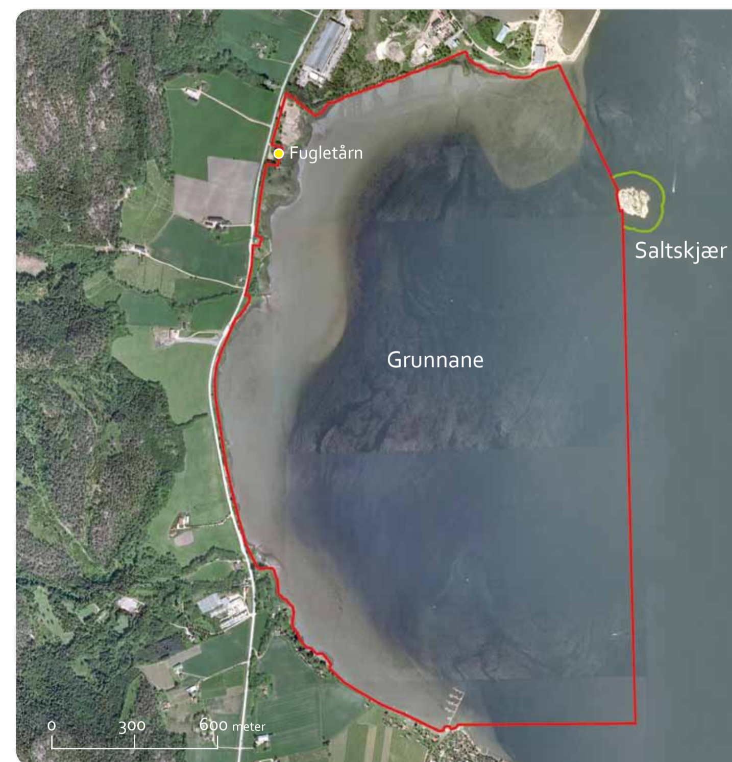
Kartgrunnla: Tillatelsesnummer Statens Kartverk, Mad 2002-R.127456, tillatelsesnummer GEOVEKST GVL-0700

Laksefiske har lange tradisjoner på flere av gårdene ved Grunnane. I 1730 søkte gården Solberg greven av Jarlsberg om å få slippe å levere den mengden fisk gården var pliktige til etter loven. Gården Solberg hadde også rett til å ta ut salt, noe som er dokumentert i regnskapet til Akershus len i 1557-58 og 1560-61. I nyere tid har det vært slått og husdyrbeite på de store strandengene rundt Grunnane. Uten skjøtsel vil deler av reservatet gro igjen med takrør og havsivaks.