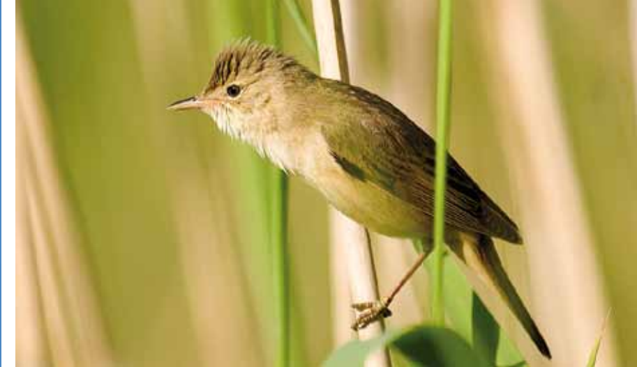
MYRSANGEREN trives i utkanten av takrørskogen