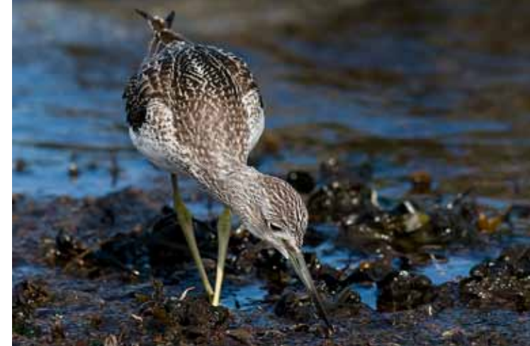
Vadefuglen GLUTTSNIPE leter etter mat i fjæra