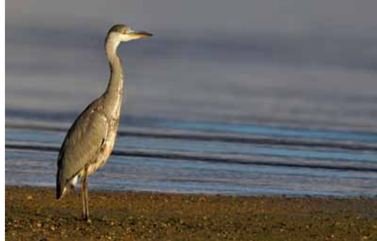
GRÅHEGRE, årvåken fisker på grunna