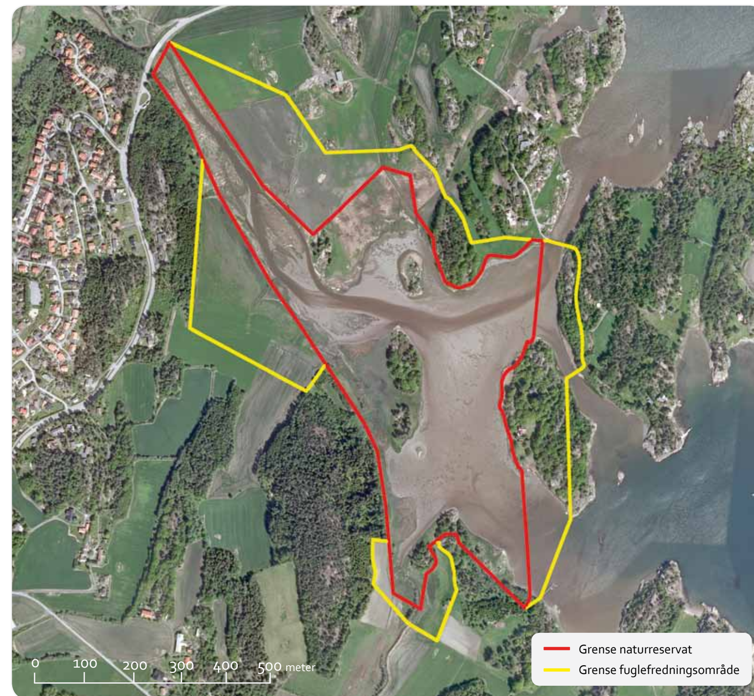
Kartgrunnlag: Tillatelsesnummer Statens Kartverk: Mad 12002-R272654, Tillatelsesnummer GEOVEKST: GV-L-0700.

Strandengene i Hemskenen har vært utnyttet til slått og husdyrbeite gjennom lang tid. Når beitedyra forsvinner, overtar takrør, et gress som kan bli over tre meter høyt. I Hemskenen omkranser takrør store deler av vannspeilet. Takrør vokser både på land og utover i vannet.