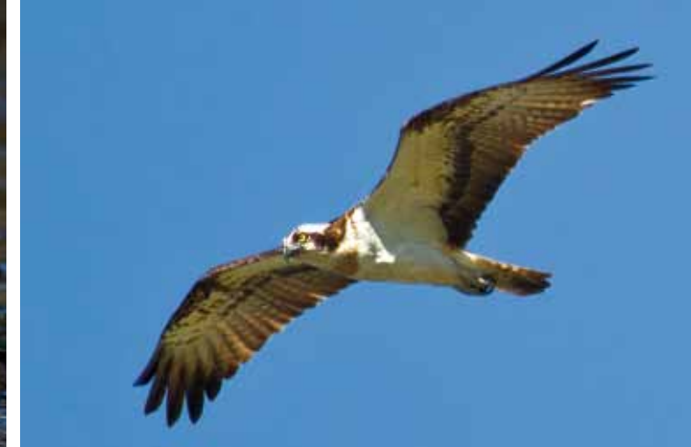
Er du heldig kan du få se FISKEØRN