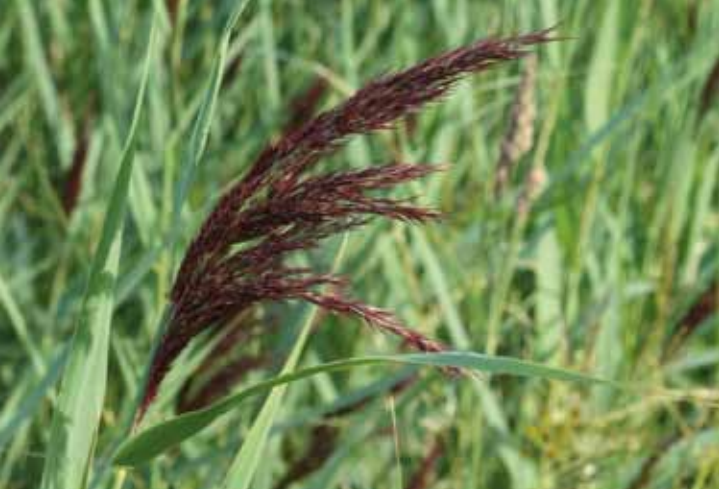
Gresset TAKRØR omkranser mye av Hemskenen