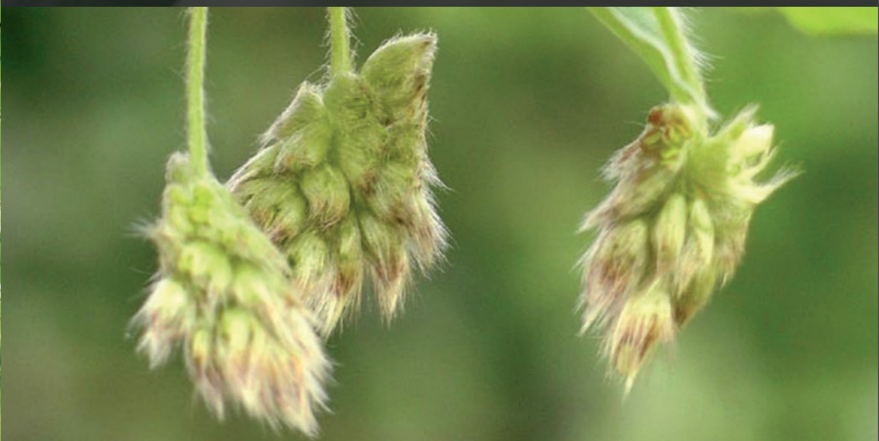
Bøken blomstrer kort etter løvspring, tidlig i mai. Treet blomstrer først fra 40-års alderen, og selv da ikke hvert år. Hann- og hunnblomster sitter i atskilte rakler.