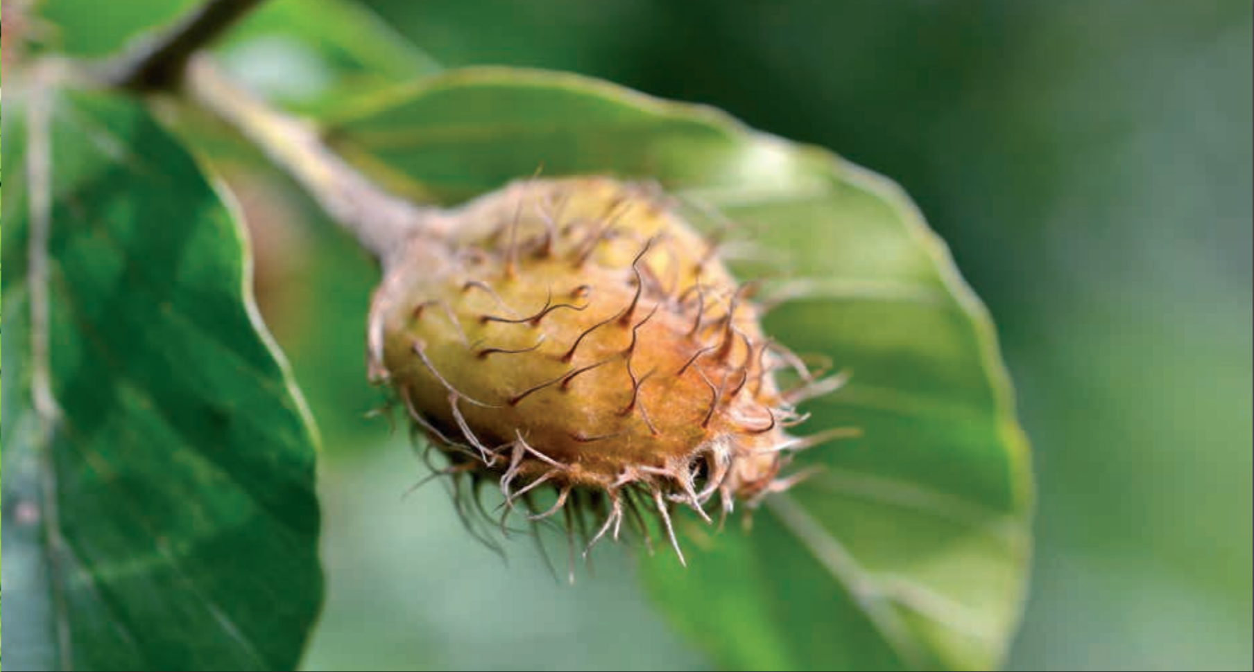
Frukten til bøketreet er trekantede nøtter.