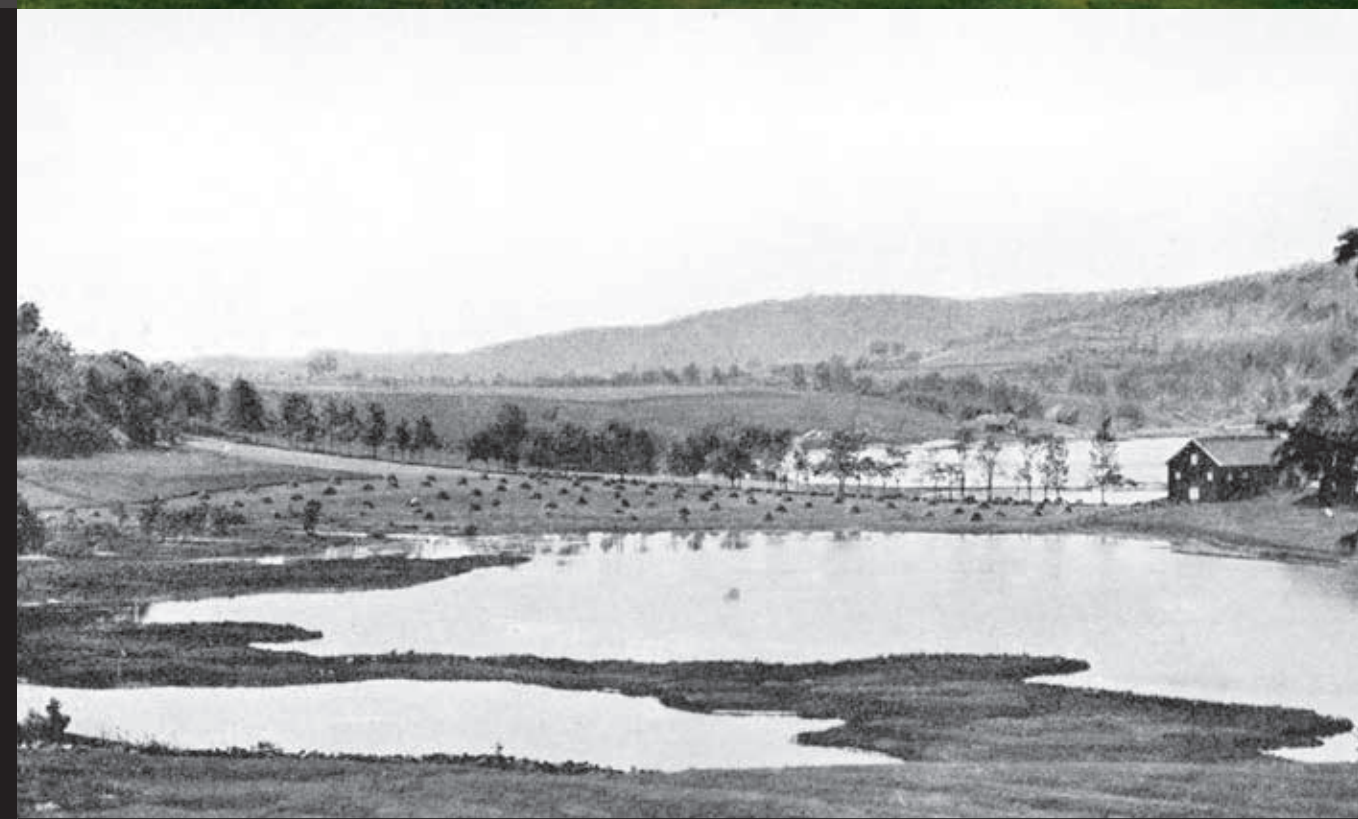
Utsikten fra "paviljongen" mot Jomfruhalvøya (til venstre) og Farriskilen i 1903.