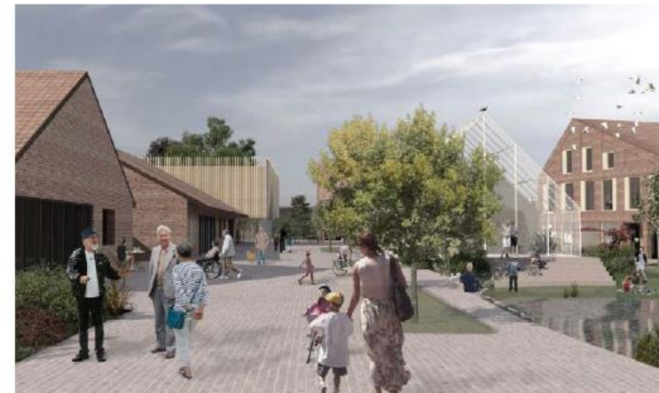
Alle illustrasjoner: Drammen kommune