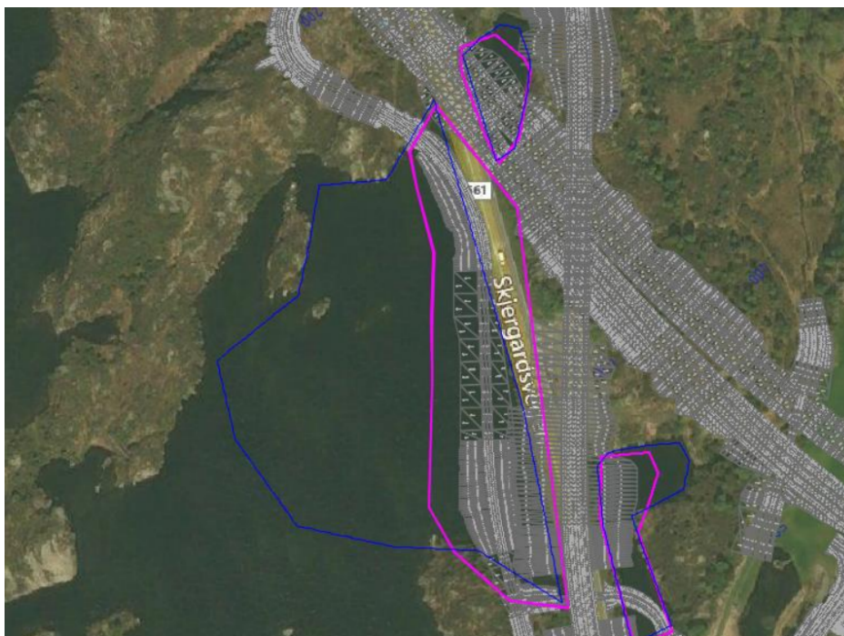
Figur 1. Skisse som viser areal i Storavatnet som kan bli påvirket av mudring (blå strek) og utfylling (rosa strek).

Det er planlagt å fylle ut inntil 65 000 m 3 sprengstein i Storavatnet for bygging av ny Rv. 555, se figur 1. Utfyllingen skal foregå fra land, og skal legge til rette for ny vei og sykkelvei. For å oppnå kvalitetsfylling skal bløte humusholdige sedimenter fjernes i området før utfylling. Mudringsvolumet er estimert til inntil 162 000 m 3 .