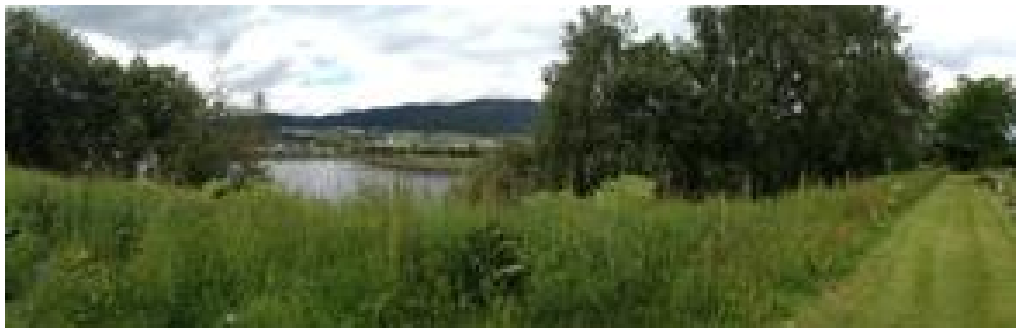
Bilde 2: Viser åpningen og retningen mot bedriften fra målepunkt 2. Målepunkt 1 er i enden av gresset opp til høyre på bildet. Målepunkt 3 er rett nedenfor på turstien ved vannspeilet.