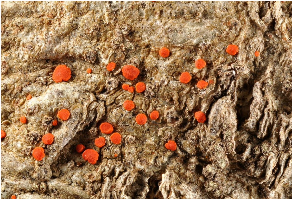
Figur 2. Oresinoberlav Ramboldia subcinnabarina (L-2373, TRH).

Oresinoberlav Ramboldia subcinnabarina (Tønsberg) Kalb, Lumbsch & Elix (figur 2) er rødlistet i kategori EN i Norge (Timdal 2015). Den tilhører familien Lecanoraceae som er en svært stor familie av hovedsakelig skorpeformete laver og omfatter en rekke slekter og arter. Slekta Ramboldia omfatter ca. 30 arter på verdensbasis og har sin største artsdiversitet på den sørlige halvkule (Kantvilas & Elix 1994 & 2007, Kalb et al. 2008, Kalb et al. 2009). Oresinoberlav tilhører den såkalte 'russula-gruppen' innenfor slekta som blant annet er karakterisert ved å ha rødt pigment i fruktlegemene (Brodo et al. 2001). I Norge er det foruten oresinoberlav bare vanlig sinoberlav Ramboldia cinnabarina som tilhører denne gruppen. Oresinoberlav ble først beskrevet av Tønsberg (1992) som Lecidea subcinnabarina . Senere ble den omkombinert i slekta Pyrrhospora av Hafellner (1993) før den så ved hjelp av molekylære metoder nå er ført til slekta Ramboldia (Kalb et al. 2008).