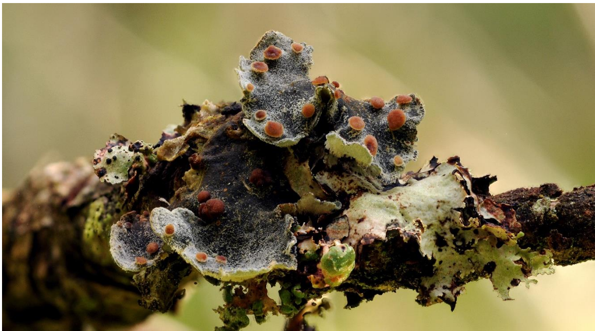
Figur 15. Trønderlav Erioderma pedicellatum på grankvist. Harran i Grong 2010.

Trønderlav er en relativt liten, gråbrun til gråblå, epifyttisk bladlav som kan bli noen cm i diameter. Tallus inneholder blågrønnbakterier av slekta Scytonema . Oversida er filthåra og danner vakkert rødbrune, først flate, senere sterkt konvekse fruktleger, som særlig utvikles langs kanten av tallus. Undersida er gråhvit med blåaktige eller bleike festetråder (rhiziner) som danner en sammenhengende matte. Trønderlav har ingen former for vegetative spredningsenheter og sprer seg derfor kun med ascosporer fra fruktlegerne. Den er derfor avhengig av tilgang på frittlevende Scytonema -alger eller andre lavarter med samme algekomponent, for eksempel trøndertustlav Lichinodium ahlneri , som vokser i samme habitat, for å danne nye lavtallus. Arten kan forveksles med små tallus av skrubbenever Lobaria scrobiculata som imidlertid mangler hår på oversida, har filthåra underside med spredte nakne flekker, danner punktforma soral på oversida og bare sjelden danner fruktleger.