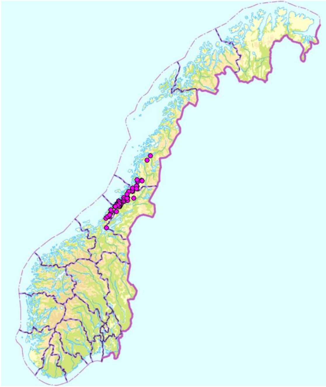
Figur 9. Kjent utbredelse i Norge og Europa for trønderringlav Rinodina disjuncta .