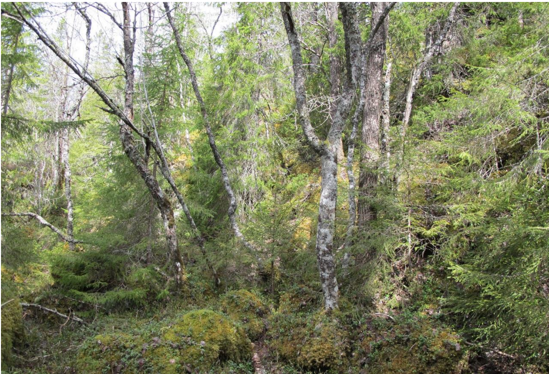
Figur 8. Habitat for trønderringlav på rogn. Hylla i Flatanger.