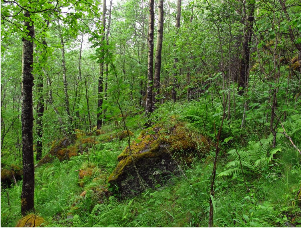
Figur 12. Habitat for granfjelllav Fuscopannaria ahlneri – Straumvatnet i Sørfold.