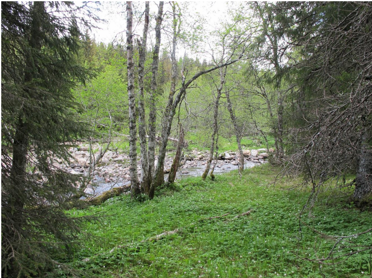
Figur 5. Typelokaliteten for oresinoberlav. Norddalselva i Åfjord.

Registrert på gråor i bekkedal av Tor Tønberg i 1982. Ingen øvrige data om habitatet foreligger. Området ble registrert på nytt i 2012 uten at det ble gjort funn av oresinoberlav. Langs bekken har det vært foretatt hogst av både gran og gråor siden 1980-tallet og området framstår som ungskog med spredte gråortrær.