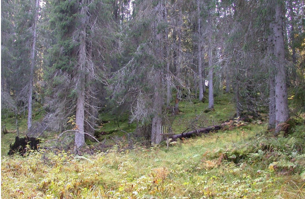
Figur 1. Boreal regnskog, Dølaelva naturreservat, Namsos kommune.

lite berørt samt at de mest omfattende stormskadene skjedde i umiddelbar nærhet til nye hogstflater, ungskog og dyrka mark.