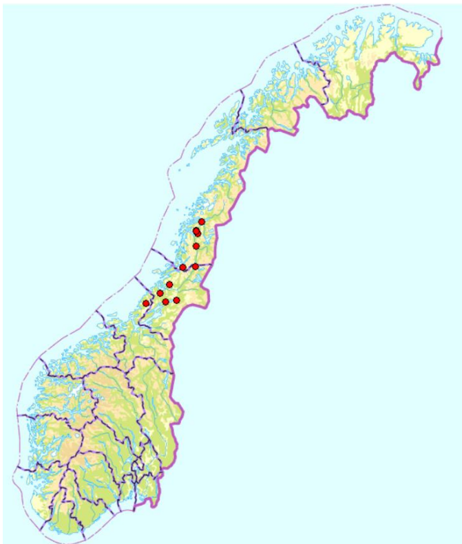
Figur 4. Kjent utbredelse i Norge og Europa for oresinoberlav.

Ingen av de norske lokalitetene er innenfor verneområder. Typelokaliteten i Åfjord er intakt, men står utsatt til i forhold til både tømmerdrift og vedhogst. Forekomsten i Finsåsmarka ble ødelagt av flatehogst i 2007. Lokalitetene i Namdalseid og Namsos ble flatehogd omkring 1990. Lokaliteten i Steinkjer ble også utsatt for hogst vinteren 2009-2010, men trærne med oresinoberlav står fortsatt igjen. I de tre nyoppdagete lokalitetene er miljøene intakt og arten forekommer på flere trær, men som regel sparsomt på hvert tre, se nedenfor. For de øvrige lokalitetene er status at arten ikke ble gjenfunnet ved nykartlegginga i 2012 og 2013, se lokalitetslista nedenfor.