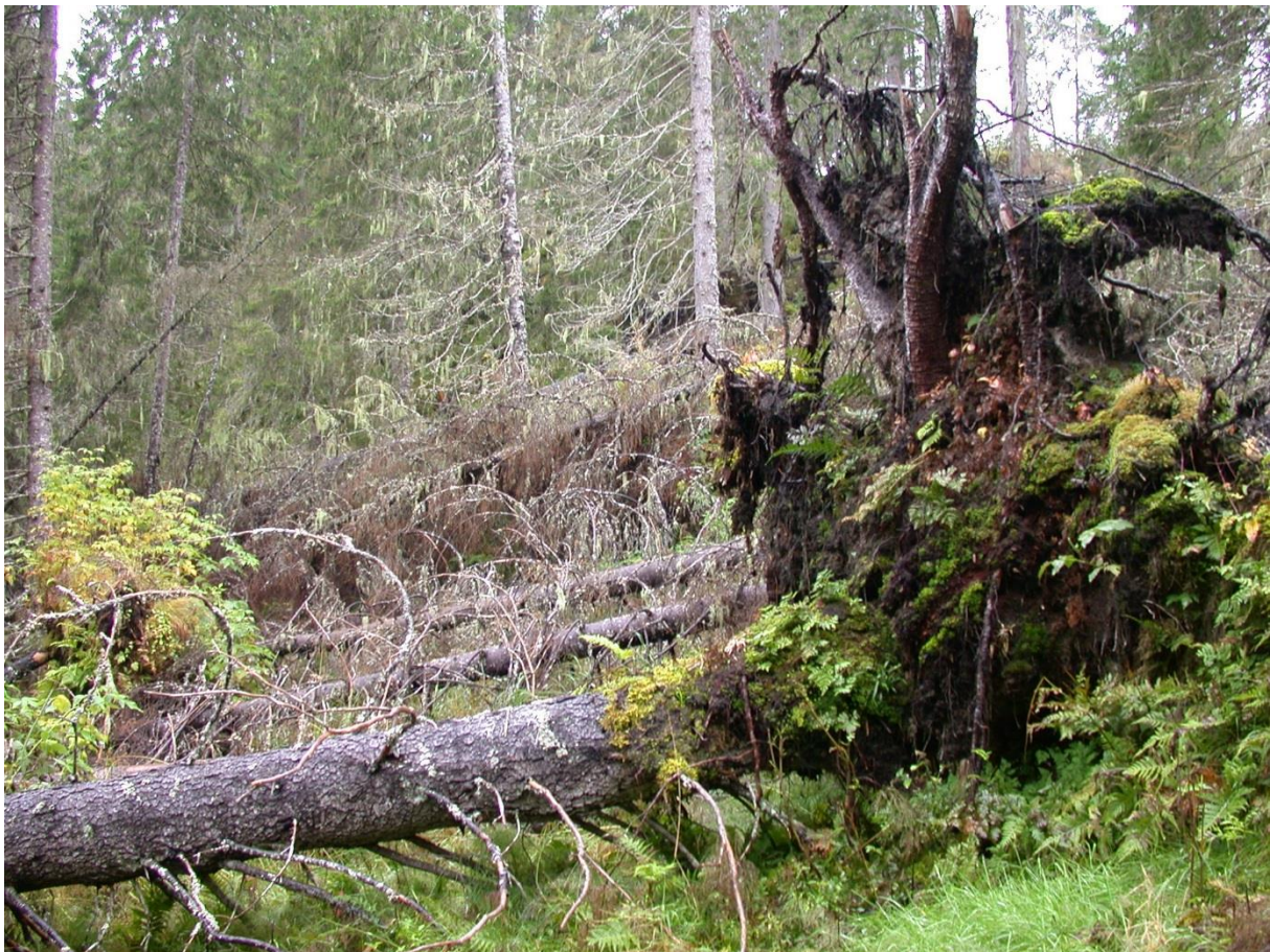
Figur 17. Vindfelling i ravine som følge av destabilisering på grunn av hogst inntil ravinekanten. Foss i Overhalla.

Energiskogbruk er ingen trussel mot noen av artene i dag, men kan være en potensiell trussel i framtiden.