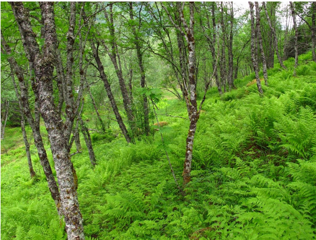
Figur 13. Habitat for granfjelllav Fuscopannaria ahlneri – Fonndalen i Meløy.