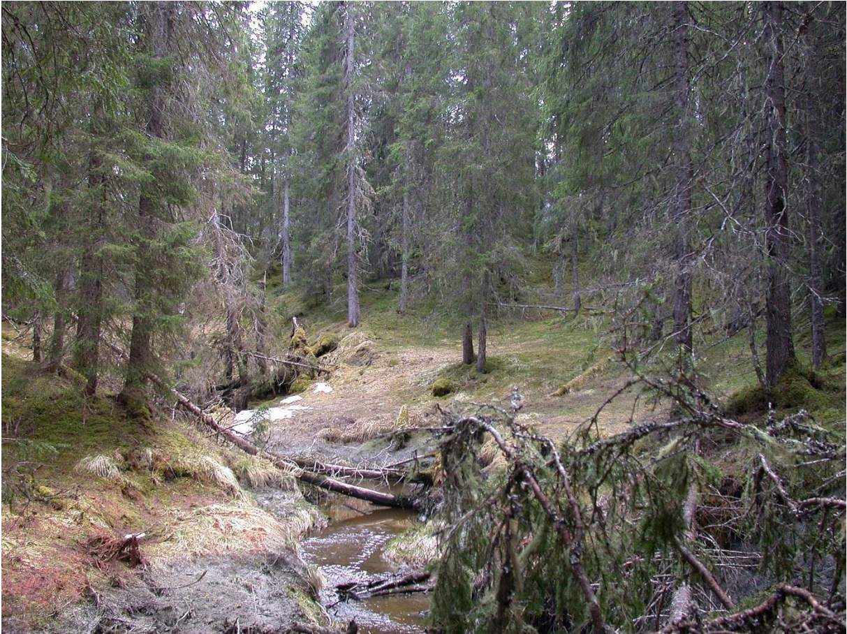
Figur 16. Habitat for trønderlav Erioderma pedicellatum – Flenga i Overhalla.