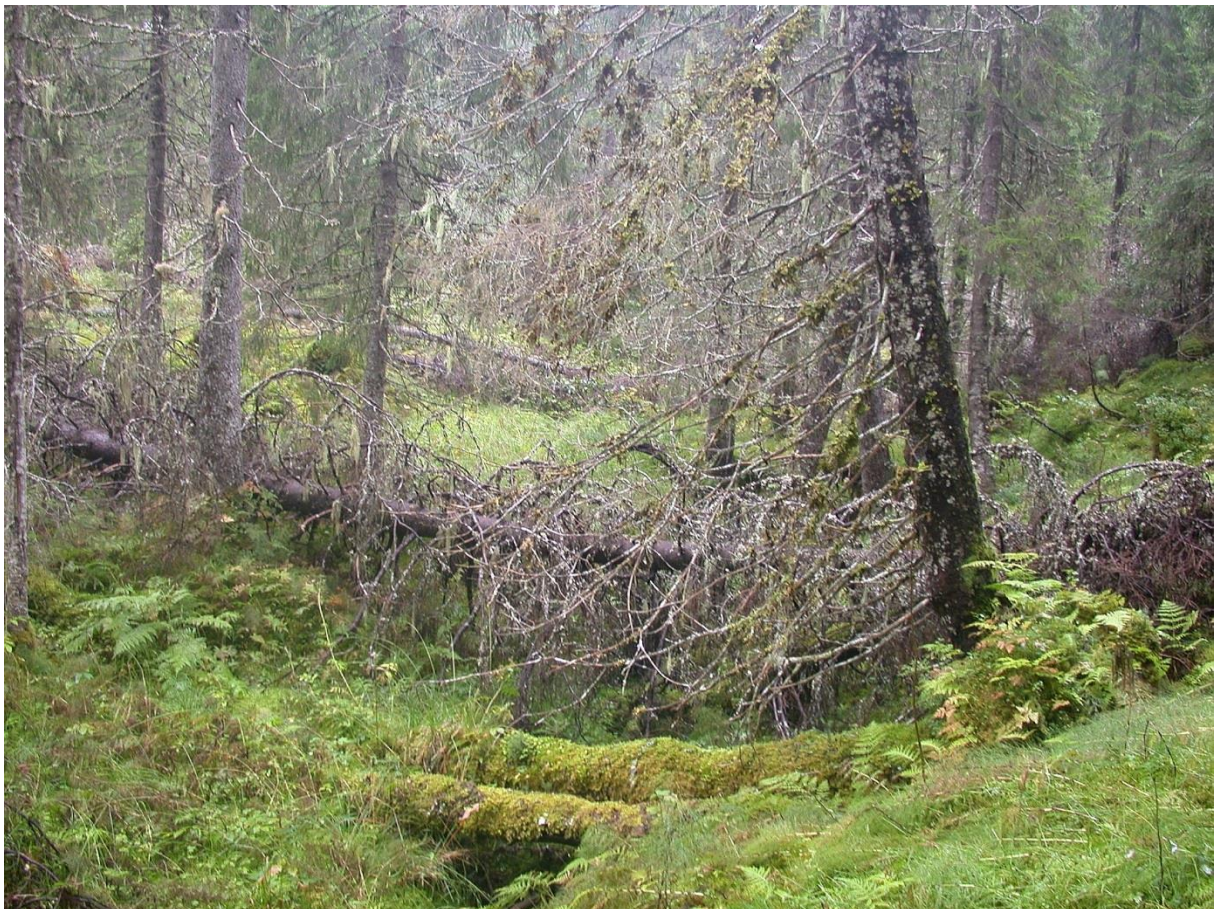
Figur 11. Habitat for granfiltlav Fuscopannaria ahlneri – ved Foss i Overhalla.

På sørvestkysten av Grønland vokser granfiltlav på rike bergvegger sammen med bl.a. fossenever Lobaria hallii og på grove vierbusker Salix sp. (Alstrup 1986).