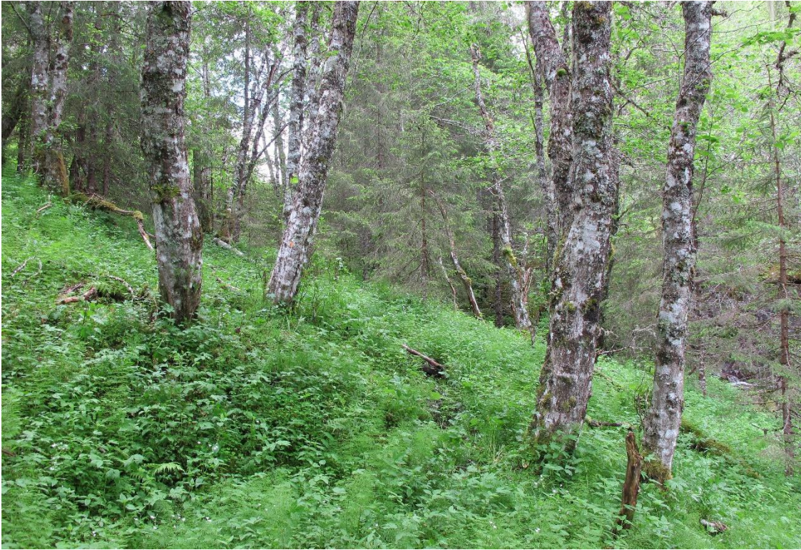
Figur 7. Habitat for trønderringlav på gråor. Trollengelva i Flatanger.