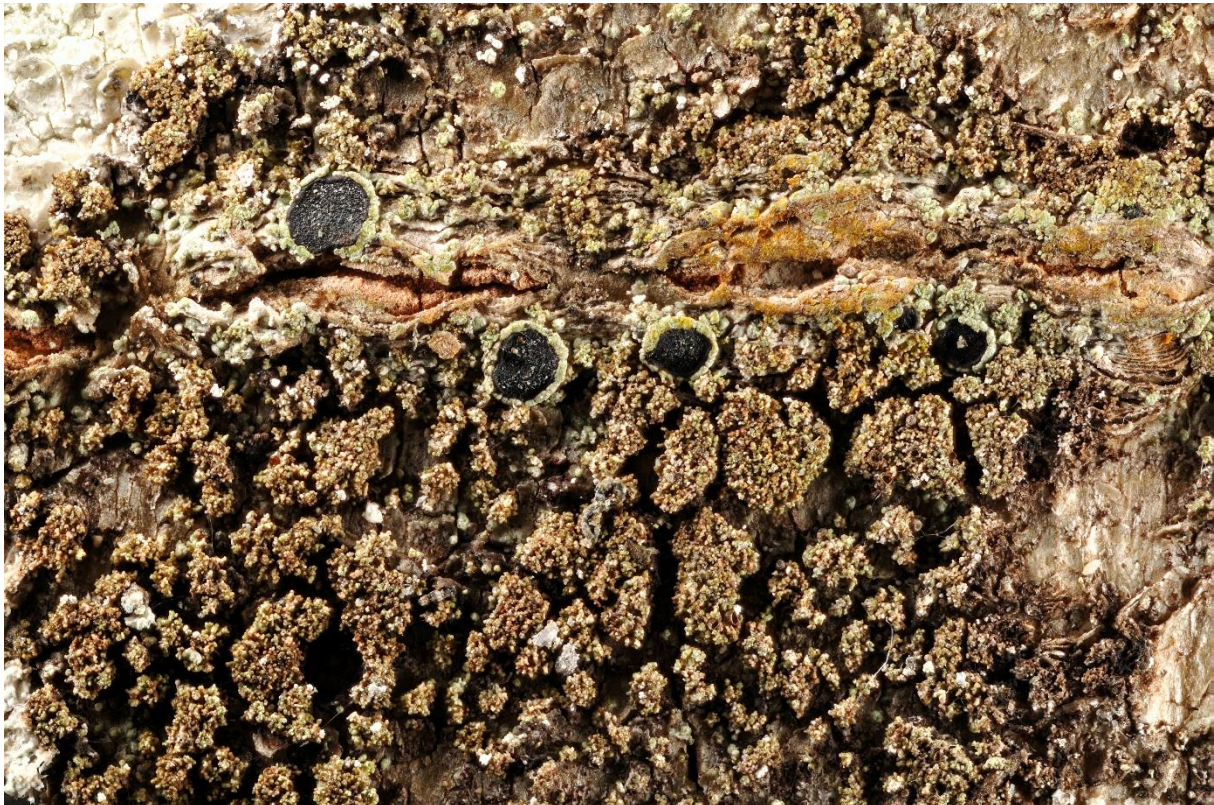
Figur 6. Trønderringlav Rinodina disjuncta (L-13554, TRH).

Trønderringlav Rinodina disjuncta Sheard & Tønsberg (figur 6) er rødlistet i kategori EN i Norge (Timdal 2015). Den tilhører familien Physciaceae som i Norden omfatter 12 slekter av både bladlaver og skorpelaver med til sammen ca. 125 arter (Ahti et al. 2002). Slekta Rinodina er en stor og komplisert slekt av skorpelaver som på verdensbasis omfatter ca. 300 arter (Sheard 2010). Fra Fennoscandia er det kjent 55 arter i slekta (Mayrhofer & Moberg 2002, Sheard et al. 2010). Trønderringlav ble beskrevet av John Sheard og Tor Tønsberg i sistnevntes doktorgradsarbeid om epifyttiske, sorediøse og isidiøse skorpelaver i Norge (Tønsberg 1992).