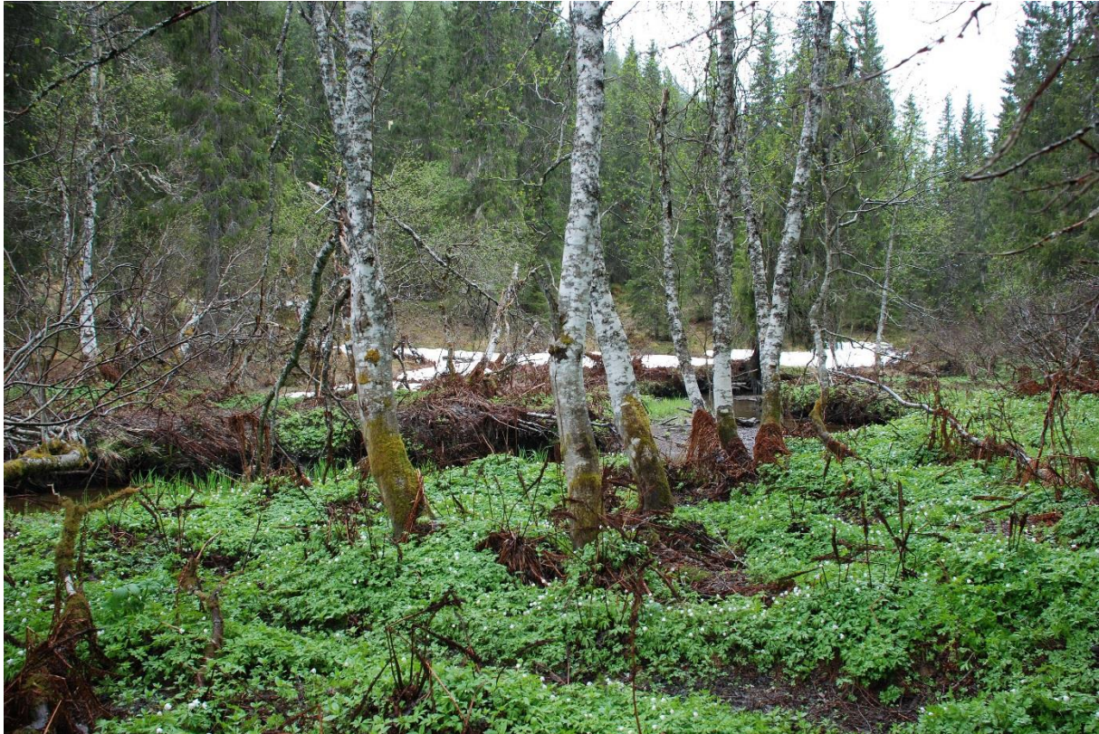
Figur 3. Habitat for oresinoberlav Ramboldia subcinnabarina . Dalbygda i Steinkjer, mai 2009.