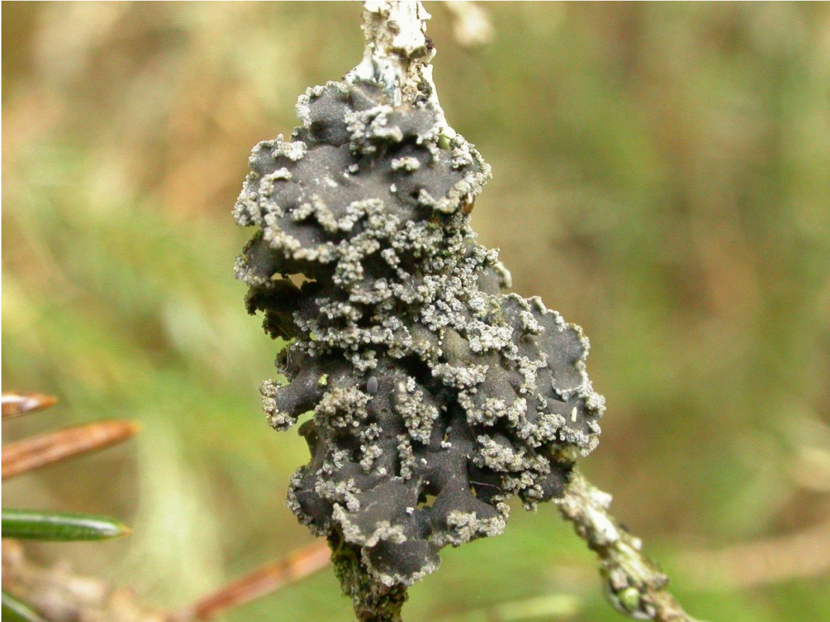
Figur 10. Granfjelllav Fuscopannaria ahlneri på grankvist. Ved Foss i Overhalla, september 2005.