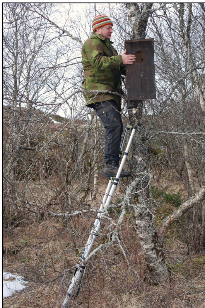
Figur 3. En av til sammen 20 rugekasser som ble satt opp i hekkeområdet til lappfiskand i Vikna i mars 2012. Mange av vannene er omgitt av blandingsskog med trær som har for liten diameter til en hulerugende art som lappfiskand.

De 20 rugekassene ble undersøkt i tidsrommet 25. – 26. juni 2019. I den forbindelse ble også tilstanden til kassene kontrollert. Samtlige fikk ny festeanordning, og ved behov ble det etterfylt høvelspon.