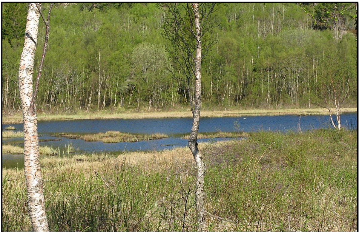
Figur 5. I rugekassen som var plassert ved dette lille tjernet ble det registrert hekking av lappfiskand i 2019.