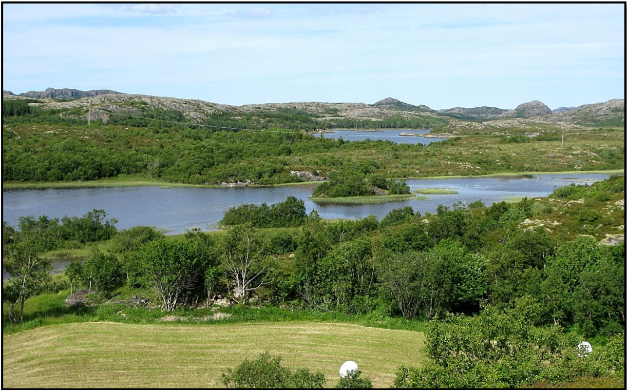
Figur 2. Mange av vannene i undersøkelsesområdet er grunne og næringsrike med frodig kantvegetasjon. Berggrunnen i Vikna består i hovedsak av harde og sure bergarter. Mange vann tilføres imidlertid næringsstoffer fra marine avsetningsmasser og avrenning fra tilgrensede jordbruksområder.

Berggrunnen i Vikna består for det meste av harde og sure bergarter, hovedsakelig diorittisk til granittisk gneis (Norges geologiske undersøkelser 2012). Det finnes imidlertid noen mindre forekomster av kalkglimmerskifer og kalksilikatskifer. Til tross for at hoveddelen av landarealet i Vikna består av harde og sure bergarter er mange av vannene i området eutrofe og vegetasjonsrike ( Figur 2 ). Dette kan forklares med lokale forekomster av marin avsetningsmasse og avrenning fra jordbruksarealer som omgir mange av vannene.