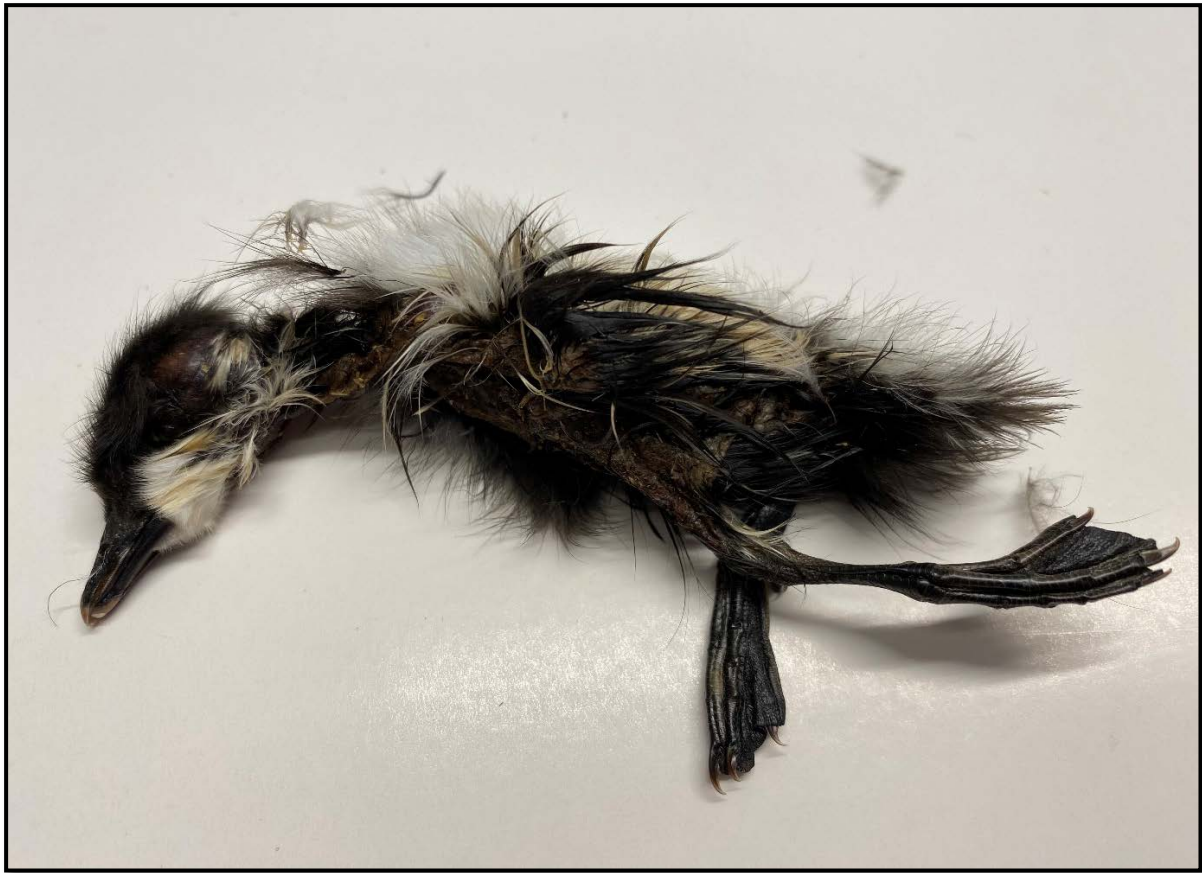
Figur 4. Nyklekt og nylig død lappfiskandunge som ble funnet sammen med eggeskall i en av rugekassene. Dette viser at lappfiskand benyttet denne kassen i 2019.