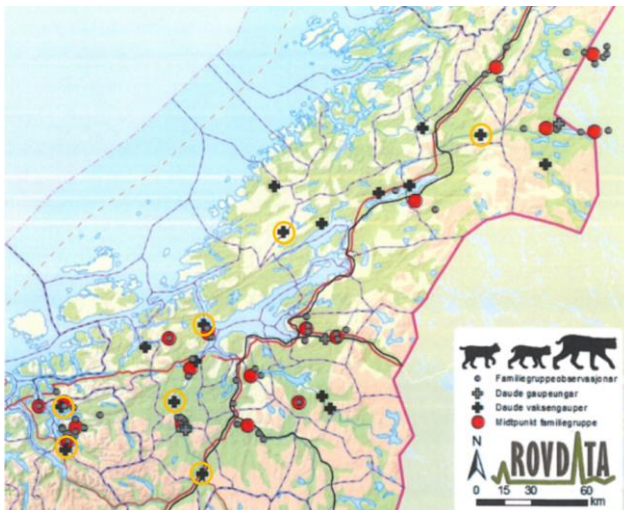
Figur 2: Kart som viser registrerte familiegupper midtpunkt (rød sirkel), familieguppeobservasjoner (grå sirkel), døde gaupeunger (grått kors), døde voksne gauper (svart kors), og døde hunngauper (gul sirkel) for perioden 01.02.21 – 01.03.21.

Registreringene av familiegupper av gaupe er noe ujevnt fordelt i regionen, med klart flest ynglinger i sørvestlig del av regionen (se figur 2). I de nordlig deler av Trøndelag er det ingen familiegupper innenfor forvaltningsområdet.