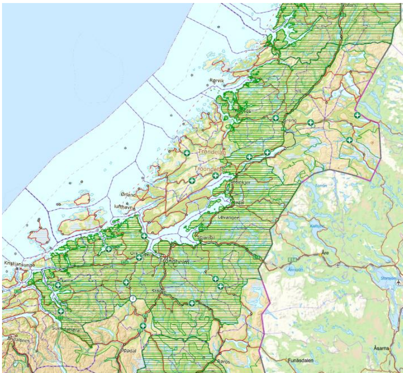
Figur 1: Skjermdump fra Rovbase 3.0, som viser geografisk fordeling av avgang av gaupe i region 6 i perioden 29.10.2020-05.03.2021, skravert område viser forvaltningsområdet for gaupe.

Totalavgang av gaupe i regionen etter at rovviltnemnda fattet vedtak om kvotejakt er følgelig 21 dyr hvorav 8 voksne hanngauper (se vedlegg 1 for nærmere informasjon).